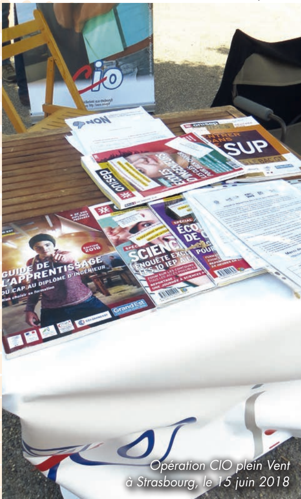
Opération CIO plein Vent à Strasbourg, le 15 juin 2018

La lutte continue avec un rendez-vous fin juin à Paris, et des actions dans les CIO. Avec le SNES FSU et les autres syndicats, sauvons les DRONISEP, sauvons les CIO.