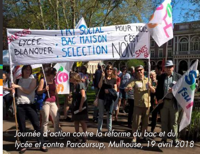
Journée d'action contre la réforme du bac et du lycée et contre Parcoursup, Mulhouse, 19 avril 2018

Ce qui officiellement n'est pas une sélection, y ressemble pourtant beaucoup. Dès l'ouverture de la plate-forme pour la communication des premiers résultats, les soupçons de classement, par les universités, des candidatures en fonction du lycée d'origine apparaissent et s'amplifient. Julien Gossa, maître de conférence à l'université de Strasbourg, vient de diffuser un document montrant que ce classement est aisément possible, via les taux de mention au bac par exemple, et que son résultat est invariablement un tri social 1 . Il faudrait, dans ce cas de figure, de meilleures notes à un élève d'un établissement de quartier populaire, pour égaler le classement d'un élève de lycée de centre ville ou d'un lycée privé (un 15/20 pour compenser un 11/20). On peut d'ores et déjà, comme vos réponses en attestent, noter des différences notables entre établissements (de l'ordre de 20 points dans le taux de réponses positives lors de la 1 ère vague).