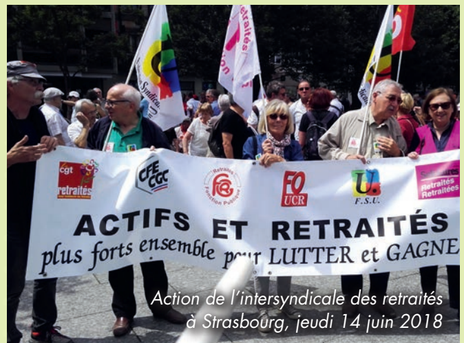
Action de l'intersyndicale des retraités à Strasbourg, jeudi 14 juin 2018

Aux futur(e)s retraité(e)s de la rentrée 2018/19 : restez syndiqué(e)s pour la défense de vos droits de retraité(e)s en gardant des liens générationnels forts dans nos deux sections conviviales de retraités 67 et 68.