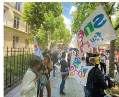
Métro Solferino place Bainville, Paris, 25 mai 2022.